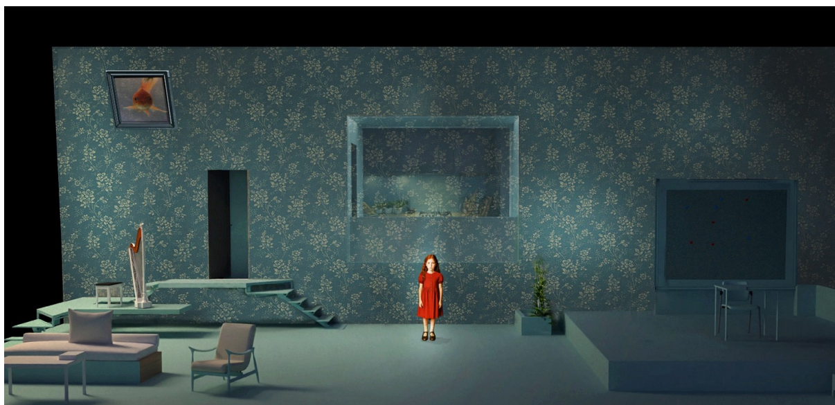
Maquette de la scénographie

Des formes simples, mais structurantes, pour que l'intime puisse se dire sans être exposé, et pour que la scène demeure un lieu de résonance.