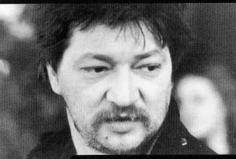
Rainer Werner Fassbinder [1945-1982]

Fassbinder aborde le théâtre à l'époque du mouvement étudiant de 1967 / 1968 à Munich. Il écrit la plupart de ses pièces de 1967 à 1971 : Le Bouc , Du Sang sur le cou du chat , Anarchie en Bavière , Les larmes amères de Petra von Kant et celle qui sera la plus jouée Liberté à Brême . Il écrit également de nombreuses adaptations pour le théâtre, d'après Marieluise Fleisser, John Gay, Goldoni, Lope de Vega. Sa dernière pièce La Ville, l'ordure et la mort est très contestée, en 1975 il démissionne de la direction du Theater am Turm