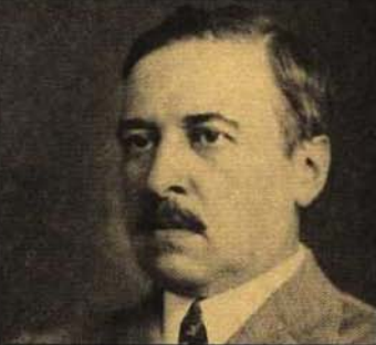
Hugo von Hofmannsthal (1874 - 1929)

24 février 1874 • Naissance à Vienne (famille d'origine juive, convertie au catholicisme et annoblie en 1825). 1884 - 1892 • Scolarité brillante au Lycée Académique 1890 • Premiers poèmes et articles sous le pseudonyme de Loris. Amitié avec le groupe "Jung Wien" (Schnitzler, Beer-Hofmann...), Renommée immédiate. 1901 • Hofmannsthal renonce à la carrière universitaire. Il se marie et aura trois enfants. 1902 • Une Lettre (dite "Lettre de Lord Chandos"). 1903 • Rencontre avec Max Reinhardt, publication d'Electre. Richard Strauss demande à Hofmannsthal la permission d'en tirer un opéra. Début de la collaboration.